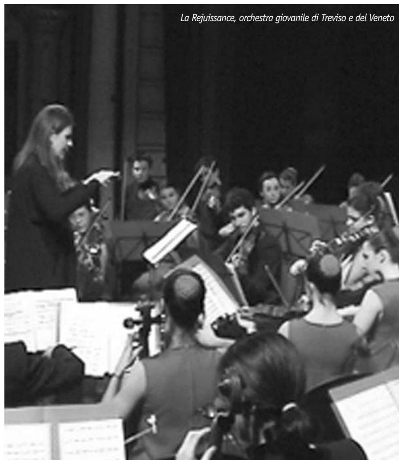
La Rejuissance, orchestra giovanile di Treviso e del Veneto

Il cambiamento epocale però avvenne grazie all'avvento del sonoro: da quel momento in poi musica e immagini sono state una cosa sola a tal punto che, spesso, un film è ricordato non per i dialoghi, ma per la colonna sonora, arrivando così alla fusione di due mondi. Oggi più che mai musica e immagini sono una cosa sola, nessun artista oggi si sognerebbe di fare un disco senza l'ausilio di un videoclip: questo perché una canzone abbinata a una piccola storia acquista una carica comunicativa travolgente in modo da catturare il pubblico senza lasciarlo respirare neppure per un attimo. E domenica 16 marzo, al Teatro Comunale di Vicenza, La Rejuissance farà vivere queste travolgenti emozioni unendo filmati e brani musicali in quel naturale connubio di sensazioni che assaporiamo ogni giorno attraverso i suoni e le immagini, che mai come nel film appaiono così complementari. Suoni e immagini riservati a 900 fortunati: lo spettacolo è già tutto esaurito.