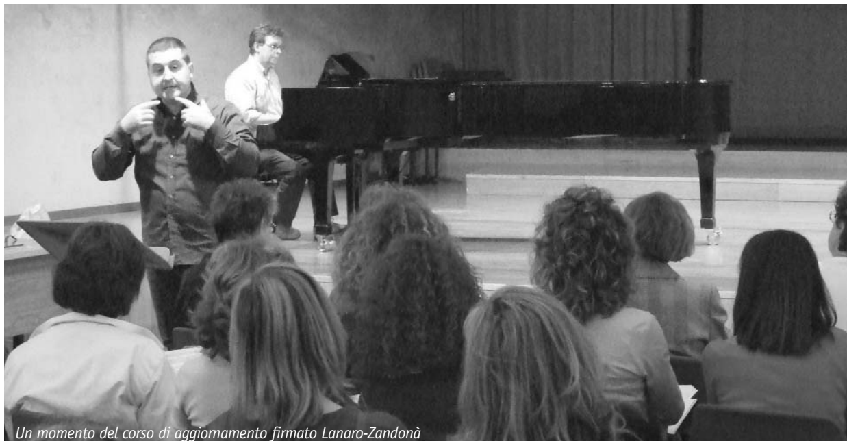
Un momento del corso di aggiornamento firmato Lanaro-Zandonà