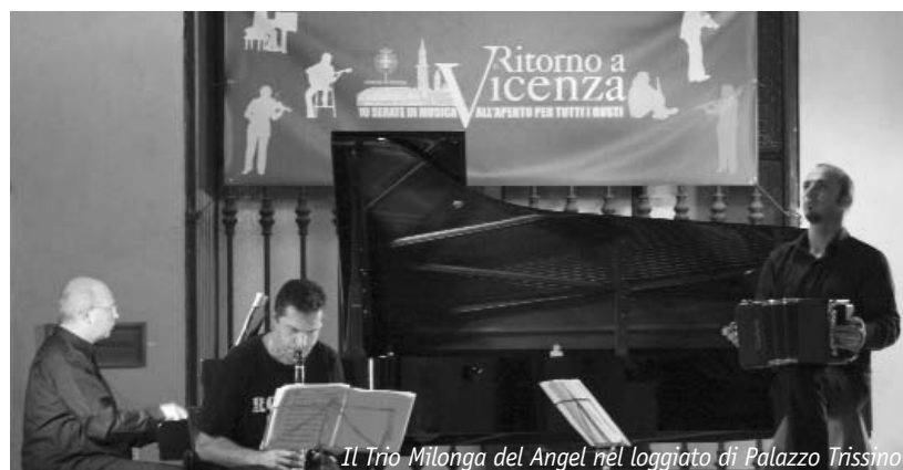
Il Trio Milonga del Angel nel loggiato di Palazzo Trissino

Il ricco programma, promosso dalla Società del Quartetto, è stato aperto dalle