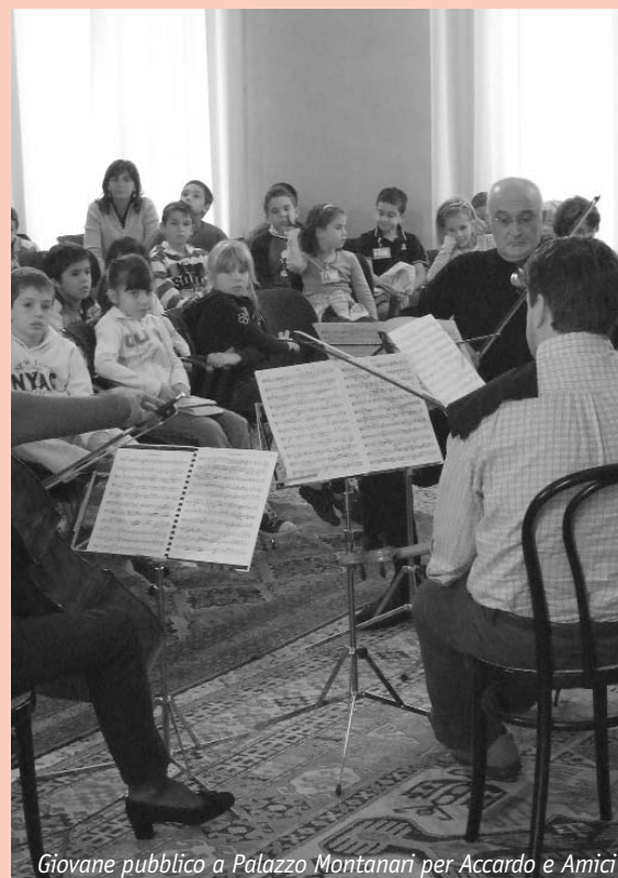
Giovane pubblico a Palazzo Montanari per Accardo e Amici

Considerati gli ottimi riscontri degli anni scorsi, e nella convinzione che l'incontro con musicisti di grande talento ed esperienza costituisca un'utile opportunità formativa per la scuola, si attendono anche quest'anno adesioni da scuole di ogni ordine e grado di tutta la provincia.