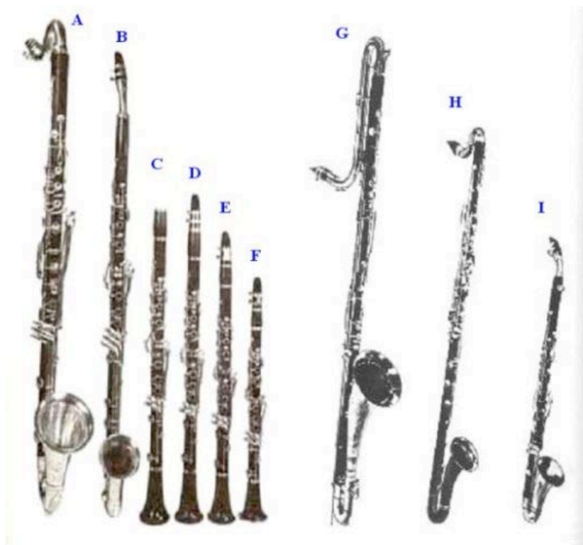
A Clarinetto basso, B Corno di bassetto in Fa, C Clarinetto in La, D Clarinetto in Sib, E Clarinetto in Do, F Clarinetto in Mib G Clarinetto contrabbasso in Sib, H Clarinetto basso in Sib, I Clarinetto alto in Mib.

Mina, non ronza soltanto, sfila con delicato passo di libellula e canta accompagnata da chitarra e una serie di magnifici strumenti della famiglia dei clarinetti.