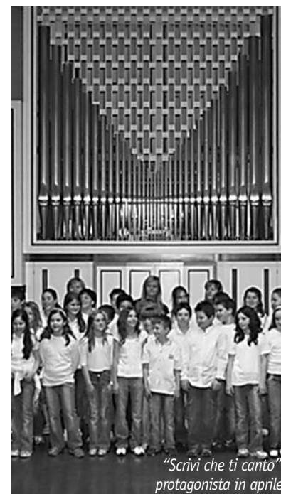
"Scrivi che ti canto" protagonista in aprile

man e Richard Hyung Ki Joo - conosciuti fra i banchi della prestigiosa Jehudi Menuhin School of Music - di diffondere la musica classica presso un pubblico più ampio. Missione compiuta, se pensiamo al successo planetario dei due funambolici musicisti e se consideriamo che sono riusciti a coinvolgere nelle loro "gags" seriosissimi artisti come il violinista Gidon Kremer e la violoncellista Natalia Gutman. "A little nightmare music" è uno spettacolo unico, pieno di virtuosismo (i due protagonisti sono peraltro degli eccellenti interpreti) di musica incantevole, di umorismo grottesco e oltraggioso. «Ideale per un pubblico dagli otto agli ottantotto anni - affermano Igudesman & Joo - questo show ti piacerà e ti farà scoppiare dalle risate, sia che tu sia appassionato di musica classica o uno che corre al riparo alla sola menzione di Mozart».