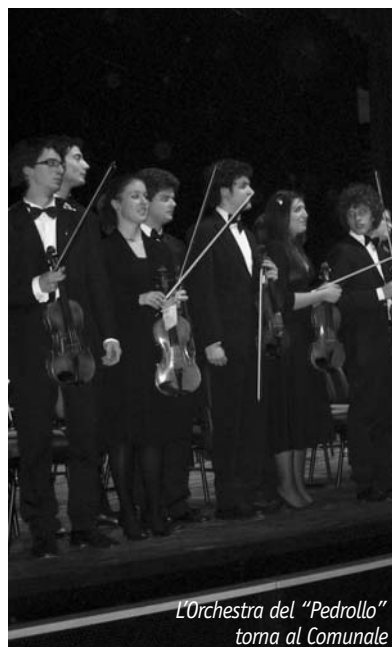
L'Orchestra del "Pedrollo" torna al Comunale