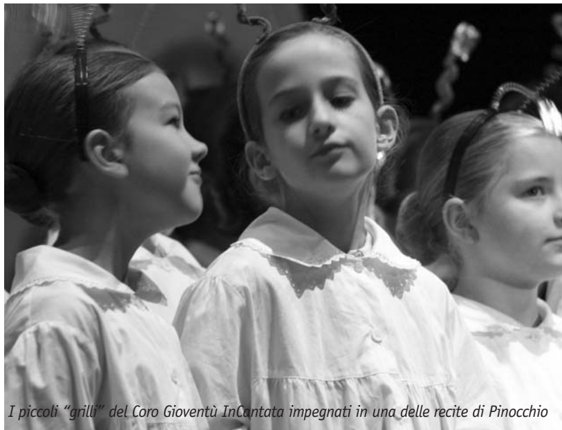
I piccoli "grilli" del Coro Gioventù InCantata impegnati in una delle recite di Pinocchio