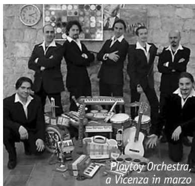
Playtoy Orchestra, a Vicenza in marzo