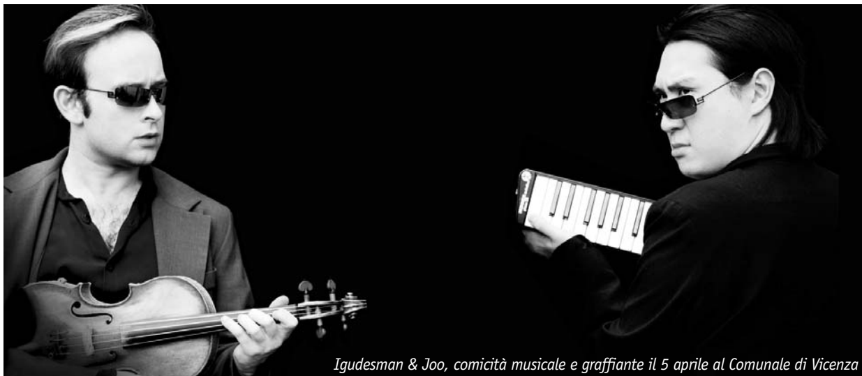
Igudesman & Joo, comicità musicale e graffiante il 5 aprile al Comunale di Vicenza

Dai giovani talenti al cabaret musicale, sei pomeriggi di grande intrattenimento per una festa in musica