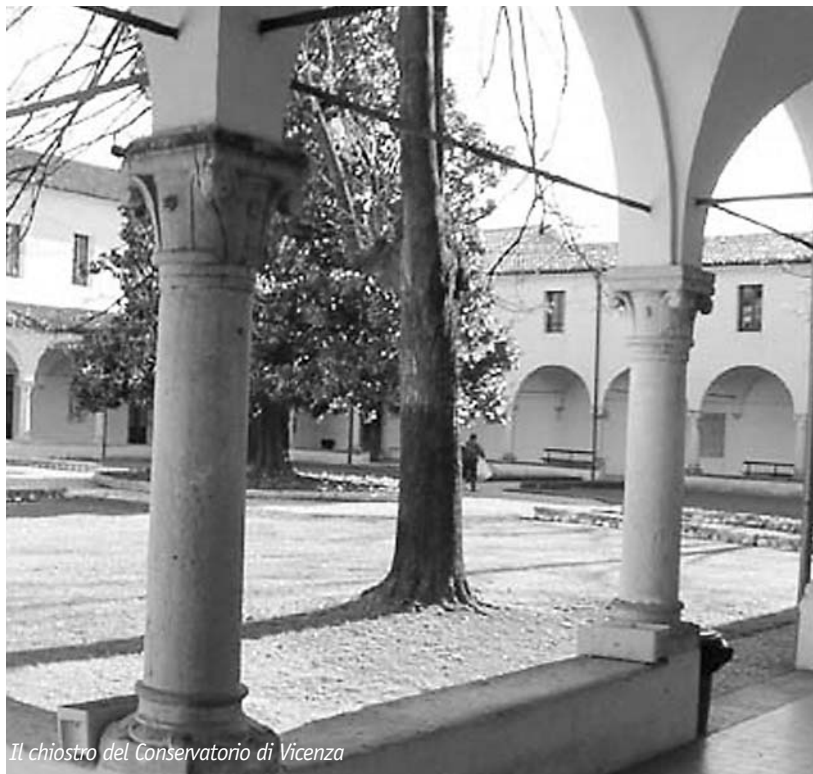
Il chiostro del Conservatorio di Vicenza